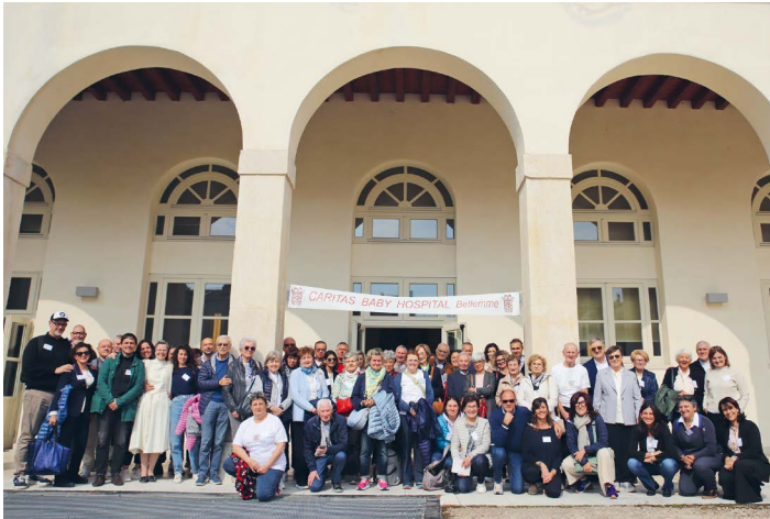
Le jubilé d'Aiuto Bambini Betlemme a reflété le fort soutien de l'Italie envers l'hôpital pédiatrique.